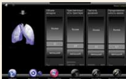
Интерфейс "Средний медицинский персонал"