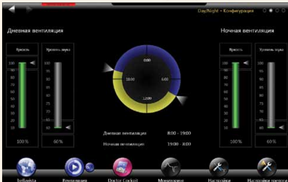
Окно режима "Двойная вентиляция"

Опционально Bellavista может быть укомплектована диагностическими инструментами мониторинга парциального давления кислорода в крови SpO 2 (пульсоксиметрия Nellcor Oxi Max) и процентного содержания CO 2 на входе и выходе (капнография Mainstream). При этом на экране мониторинга пациента появляется отображение следующих параметров: плетизмограмма, частота пульса, парциальное давление O 2 в крови, EtCO 2 insp., EtCO 2 exp. Также возможно включение тревоги по данным параметрам.