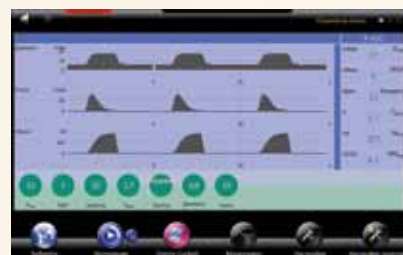
Интерфейс "Chameleon green"