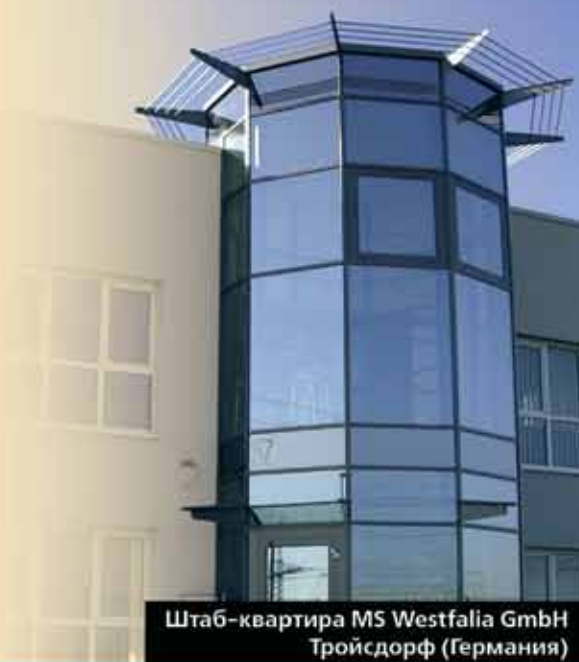
Штаб-квартира MS Westfalia GmbH Тройсдорф (Германия)