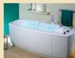
Косметологическое и SPA-оборудование