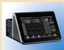
Оборудование для анестезиологии и интенсивной терапии