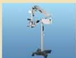
Микроскопы и кольпоскопы