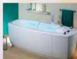
Косметологическое и SPA-оборудование