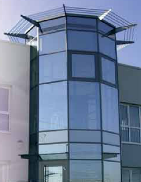
Штаб-квартира MS Westfalia GmbH Тройсдорф (Германия)