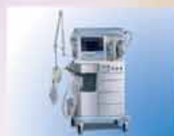
Оборудование для анестезиологии и интенсивной терапии