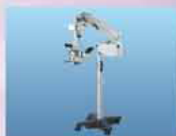
Микроскопы и кольпоскопы