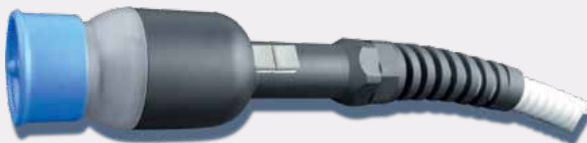
Лимфодренажная рукоятка «Вакуумный Массаж» для работы по лицу