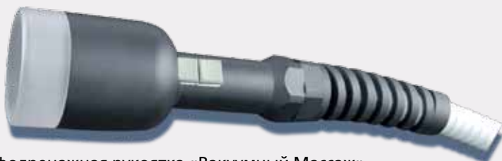
Лимфодренажная рукоятка «Вакуумный Массаж» для работы по телу